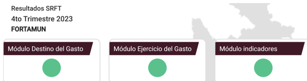
Imagen 2: Ejemplo de Semaforización de Módulos del SRFT

Es importante mencionar que cada informe trimestral cuenta con la semaforización de los Módulos reportados por parte del Municipio, la cual es emitida por parte de la Coordinación General de Planeación, Seguimiento y Evaluación de la Secretaría de Bienestar.