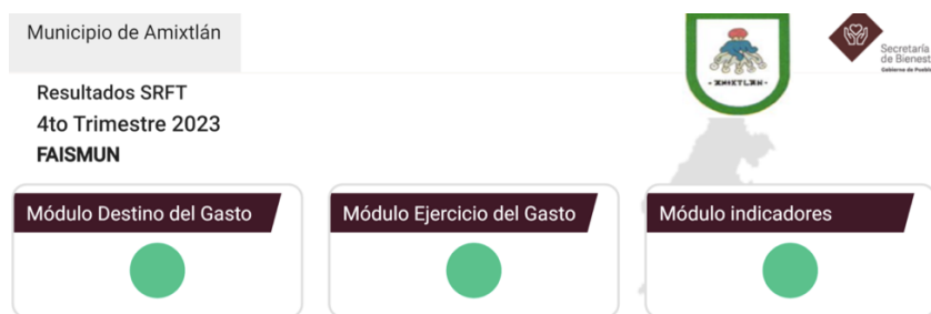
Imagen 2: Ejemplo de Semaforización de Módulos del SRFT

Es importante mencionar que cada informe trimestral cuenta con la semaforización de los Módulos reportados por parte del Municipio, la cual es emitida por parte de la Coordinación General de Planeación, Seguimiento y Evaluación de la Secretaría de Bienestar.